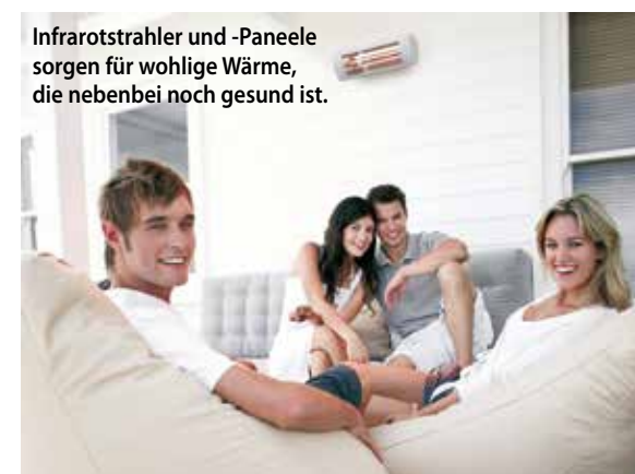
Infrarotstrahler und -Paneele sorgen für wohlige Wärme, die nebenbei noch gesund ist.

Effizient heizen. Im Bereich der Elektro-Heizungstechnik wartet Rowa-Moser mit einem Komplettsortiment auf, das unter anderem Fußbodenheizungen, Freiflächenheizungen, Dachheizungen, Industrieheizgeräte, Gastronomie- und Hotelleriebeheizung sowie Direktheizgeräte umfasst. Auch im Heizungsbereich wird von sachkundiger Beratung über Planung bis hin zur perfekten Ausführung alles aus einer Hand geboten. Für den Endkunden hält Rowa-Moser Wandkonvektoren aus Stahl, Marmor oder Glas bereit, die nicht nur funktional sind, sondern