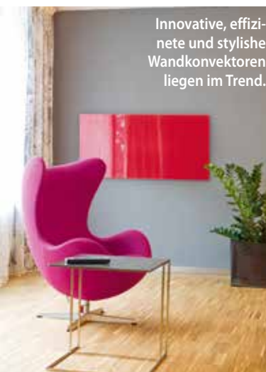
Innovative, effiziente und stylische Wandkonvektoren liegen im Trend.