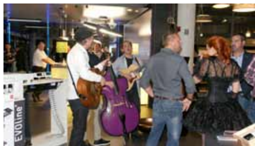
Sorgte mit ihrem swingenden Sound für beste musikalische Unterhaltung: die Band Brennholz

Weitere Informationen: Rowa-Moser Innsbruck (0512/33 770, office.ibk@rowa-moser.at) Klagenfurt (0463/35 559, office.klgft@rowa-moser.at) Linz/Leonding (0732/68 00 88, office.linz@rowa-moser.at) Hohenems/Vorarlberg (05576/72674, office.vbg@rowa-moser.at) Vertriebspartner Guntramsdorf (02236/53 435, office.gtdf@rowa-moser.at) www.rowa-moser.at