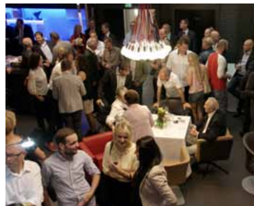
30-Jahre-Fest bei Rowa-Moser in Innsbruck