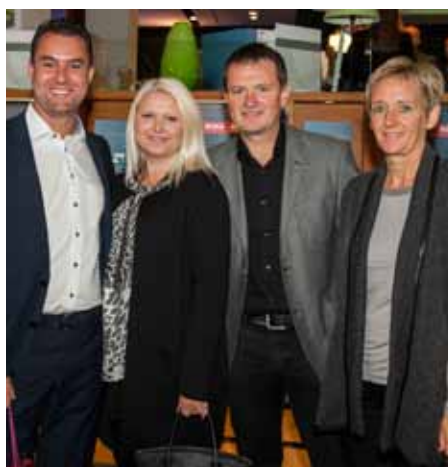
... die Geschäftsführung der Fa. Klampfer mit Ehefrauen, ein langjähriger Großkunde und Freund des Hauses, ...