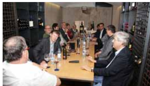
Auch der Weinkeller des Hauses war für die Gäste offen