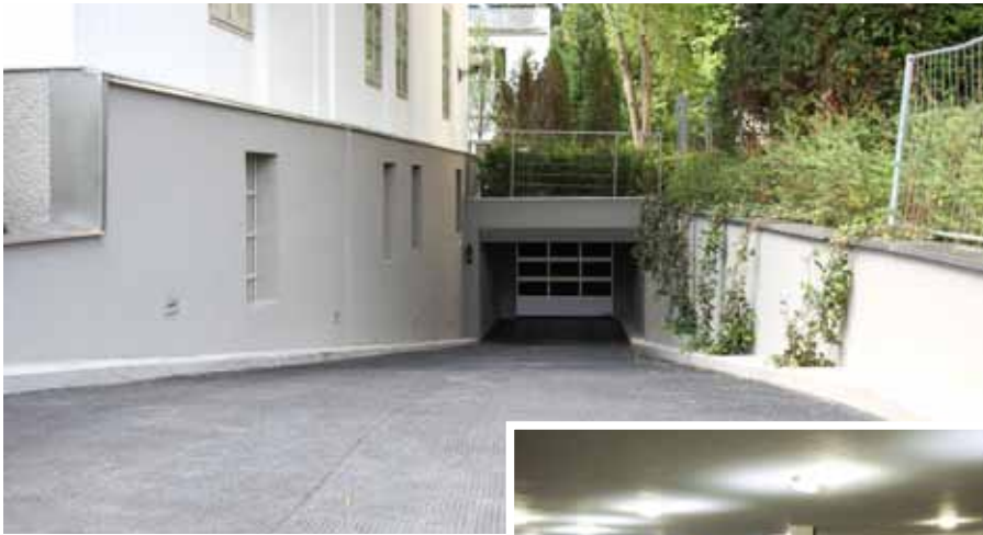
Bei dem Projekt in Wien-Hietzing sorgt die Rampenheizung in Gußasphalt für Schnee- und Eisfreiheit und damit für ein sicheres Befahren und Begehen