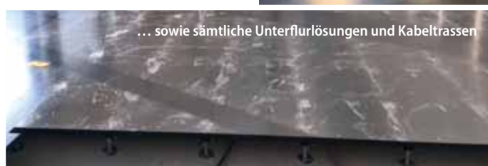
... sowie sämtliche Unterflurlösungen und Kabeltrassen

Auch wenn es um die Oberbeläge geht, kann Rowa-Moser durch ein Netzwerk namhaftester Belag-Hersteller praktisch jeden Wunsch erfüllen. So können Design- und Optikwünsche mit