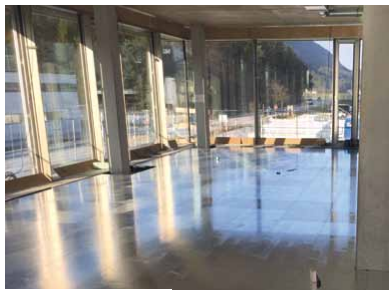
Bei Pharmaproduzent Sandoz in Langkampfen werden 4.500 m 2 Doppelböden samt Belägen aus dem Hause Rowa-Moser installiert ...

schutzeigenschaften (Rauchdichtigkeit). Bei Schaltwartenböden, Schwerlastbereichen und Tunnelanlagen beweist Rowa-Moser seine Kompetenz mit Sonderlösungen.